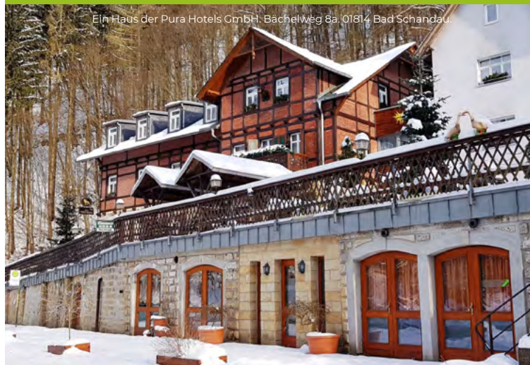
Ein Haus der Pura Hotels GmbH, Bächelweg 8a, 01814 Bad Schandau

Kirnitzschtalstraße 5 01855 Kirnitzschtal- Bad Schandau Telefon: 035022-5840 www.pura-hotels.de